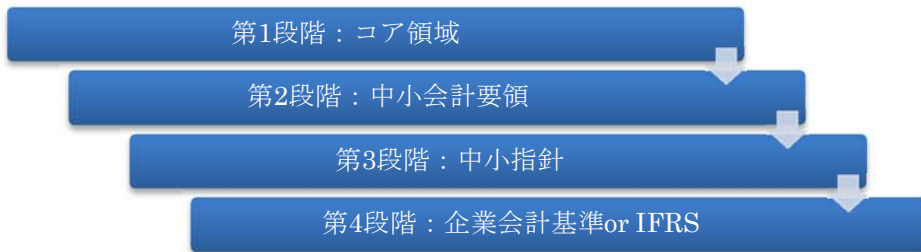
図表3 理想的な段階的教育

以下の図表3にあるように、第1段階として、いずれの基準にも関係するベースとなる「コア領域」の学習を経た後に少しずつ階段を上がるというイメージである。